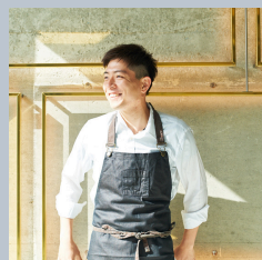
糸井 章太 Aubeige "eafeu"シェフ

1964年熊本県天草市生まれ。日本大学芸術学部放送学科在籍中に放送作家としての活動を開始。「料理の鉄人」「カノッサの屈辱」など斬新なテレビ番組を数多く企画。脚本を担当した映画「おくりびと」で第32回日本アカデミー賞最優秀脚本賞、第81回米アカデミー賞外国語部門賞を獲得。執筆活動の他、2025年大阪・関西万博のテーマ事業プロデューサーなどを務める。熊本県のPRキャラクター「くまモン」の生みの親でもある。